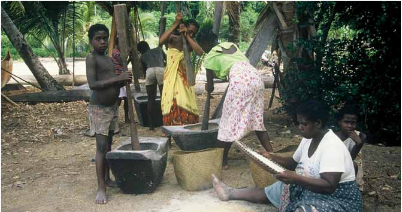
Ein frühzeitige Einbindung der lokalen Bevölkerung erhöht die Akzeptanz für das Projekt und hilft positiven Zusatznutzen zu schaffen.