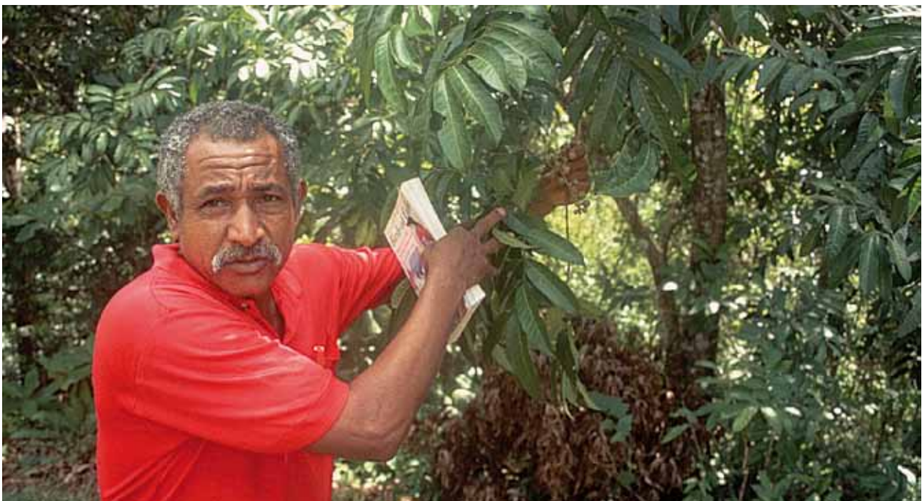
Projekteffekte für die Menschen vor Ort können durch Wirkungsstudien und Monitoring kontrolliert werden.

Das Prinzip der so genannten „freien, vorherigen und informierten Zustimmung“ (FPIC - engl. free prior and informed consent) fasst zusammen, wie die lokale Bevölkerung mit Land- und Nutzungsrechten schon vor dem Vorhaben eingebunden und konsultiert werden muss. Es schreibt auch das Recht lokaler Gemeinden fest, einer ihren Lebens- oder Wirtschaftsraum beeinflussende Maßnahme zuzustimmen oder sie abzulehnen.