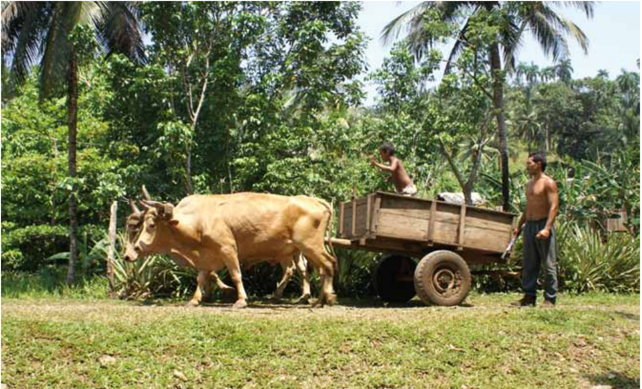
Standards sollten Vorgaben zur Bodenbearbeitung machen und die Auswirkungen auf den Wasserhaushalt mit einbeziehen.

ausschließen (mit der Ausnahme von Kulturpflanzen, wie z.B. Kaffee), um die Nachhaltigkeit des Projekts sicherzustellen.