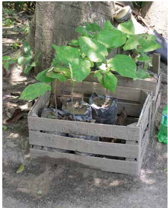
Aufforstung mit Baum-Setzlingen ist eine Möglichkeit, durch Waldprojekte das Klima zu schützen.