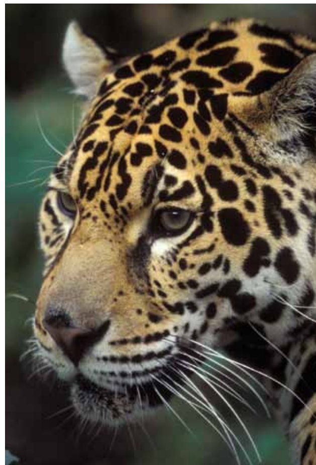
Waldklimaprojekte können zum Erhalt seltener Tierarten wie dem Jaguar ...

können. Der CDM umfasst hauptsächlich Vorhaben im Energiesektor, aber auch Kompensationsprojekte im Waldbereich . Die Kriterien zur Anerkennung als CDM-Projekt wurden von der UN-Klimarahmenkonvention entwickelt und sind seit 2001 nutzbar. Im Waldbereich sind unter dem CDM nur Aufforstungs- und Wiederaufforstungsprojekte (Afforestation / Reforestation, A/R) zugelassen. Die von einer internationalen Gruppe von Wissenschaftlern entwickelte Methodologie für die genaue Messung und Berechnung der gebundenen Treibhausgase wird als CDM-AR bezeichnet. Viele weitere Standards basieren auf dieser Methodologie und haben sie vereinfacht oder weiterentwickelt. Bis zum Januar 2011 wurden unter dem CDM-AR 18 Waldprojekte registriert und weitere 42 Projekte befinden sich in der Vorbereitung.