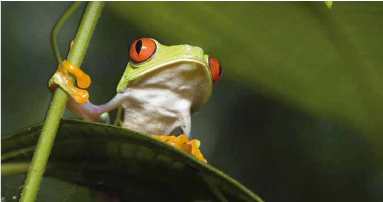
Besonders schützenswert sind Waldgebiete, wenn sie seltene oder vom Aussterben bedrohte Arten beheimaten.