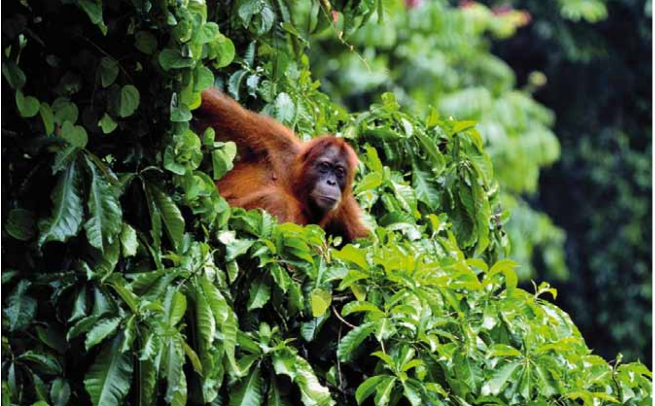
Durch die Erhebung und permanente Kontrolle von Daten zum Bestand verschiedener Arten werden ökologische Projektwirkungen überwacht.