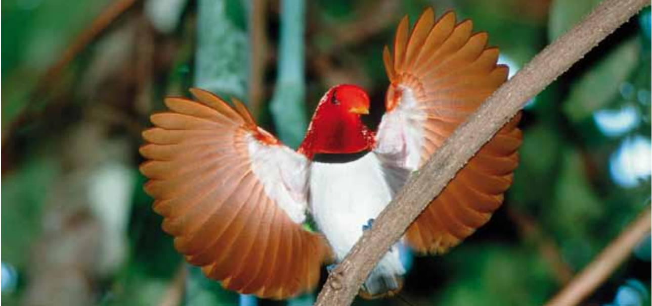
... oder dem Paradiesvogel beitragen. Jedoch überprüfen nicht alle Standards die ökologischen Wirkungen der Projekte.