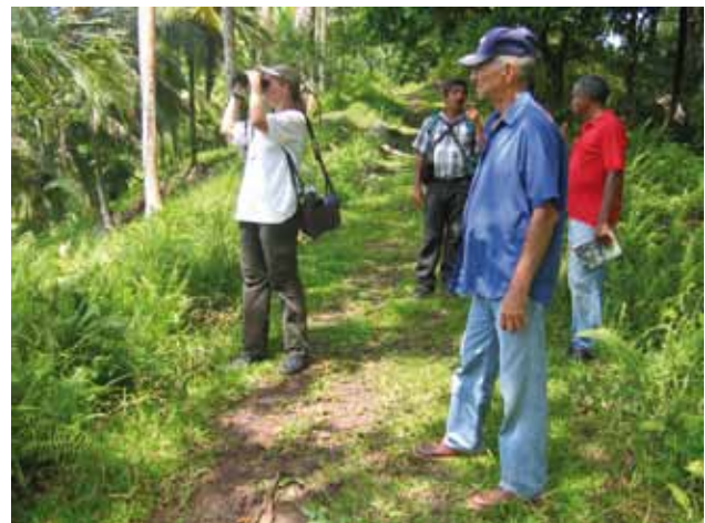
Eine Waldinventur ist die Grundlage für eine sorgfältige Treibhausgasberechnung.

Bei den Berechnungen kann es zu einem Zielkonflikt zwischen Genauigkeit der Kalkulation und dem Kostenaufwand kommen. Oftmals muss auf Stichproben und historische Daten zurückgegriffen werden.