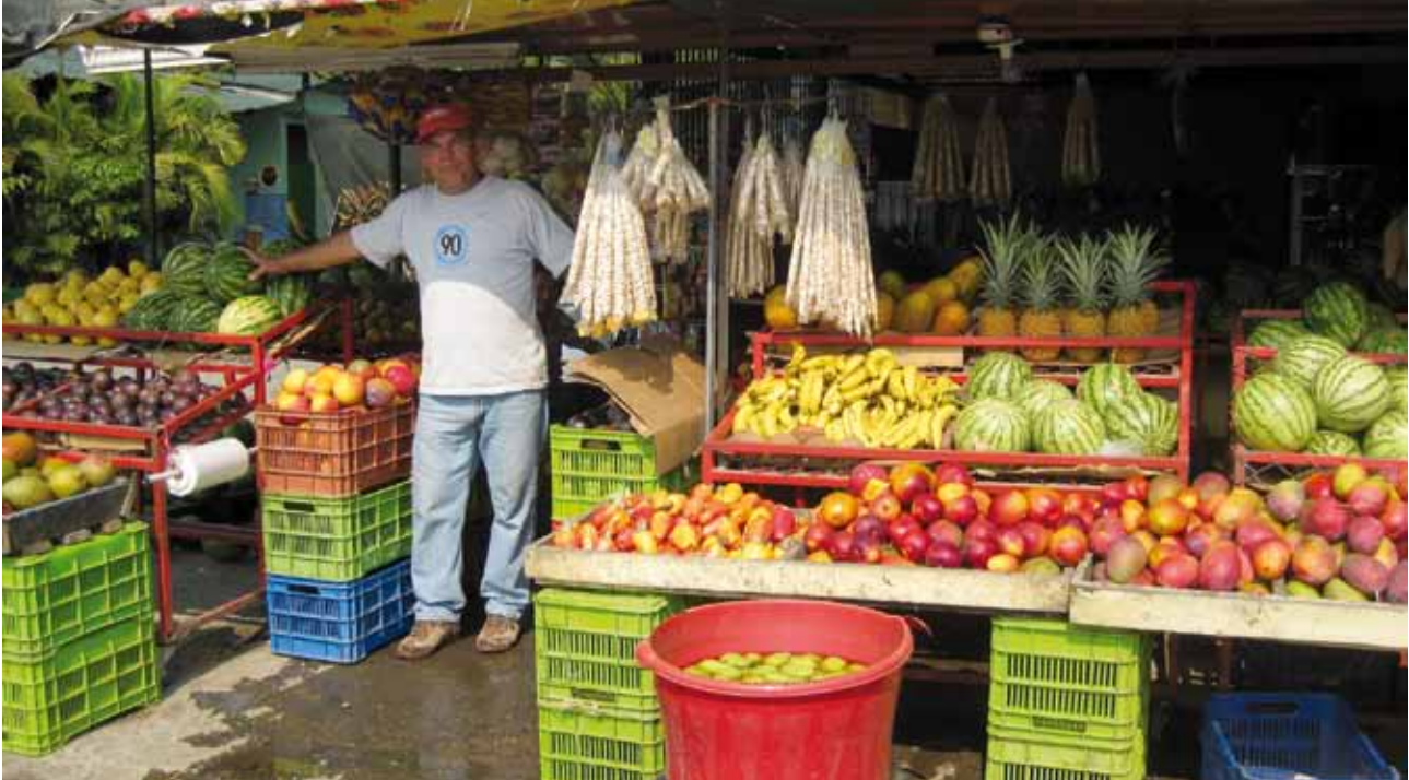
Waldklimaprojekte können nur erfolgreich sein, wenn sie eine Lebensgrundlage für die lokale Bevölkerung bieten.

Zertifikaten zu eliminieren. Das hat allerdings den Nachteil für den Investor, dass immer wieder nachzertifiziert werden muss, bzw. nach Ablauf neue Zertifikate gekauft werden müssen.