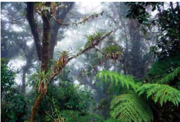
Waldschutz ist Klimaschutz.

W aldklimaprojekte zur Kompensierung von CO 2 -Emissionen liegen voll im Trend. Immer mehr Unternehmen investieren in den Kohlenstoffspeicher Wald. Doch die Unsicherheit, nach welchen Kriterien die Projekte ausgewählt werden sollen, bleibt groß. Neben der CO 2 -Speicherung spielt die soziale und ökologische Integrität der Projekte eine entscheidende Rolle. Diese Leitlinien helfen Ihnen, sich im Dschungel der verschiedenen Projekttypen und Qualitätsstandards zurechtzufinden.