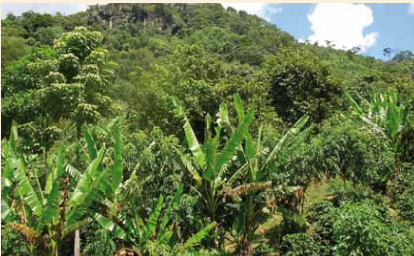
Agroforstwirtschaft, hier mit Bananenbau, ist eine Möglichkeit nachhaltiger Landnutzung, die alternative Einkommensquellen für die lokale Bevölkerung schaffen kann.

geht an die Wildlife Conservation Society (WCS), die damit u.a. die Projektkomponenten zur Förderung neuer Einkommensquellen und alternativer Landnutzungsformen finanziert. Der größte Anteil der Gelder – etwa 50 Prozent – soll direkt den Gemeinden zukommen. Dazu wird ein Fonds etabliert, aus dem sie finanzielle Unterstützung für ihre Waldschutz- und Entwicklungsaktivitäten erhalten.