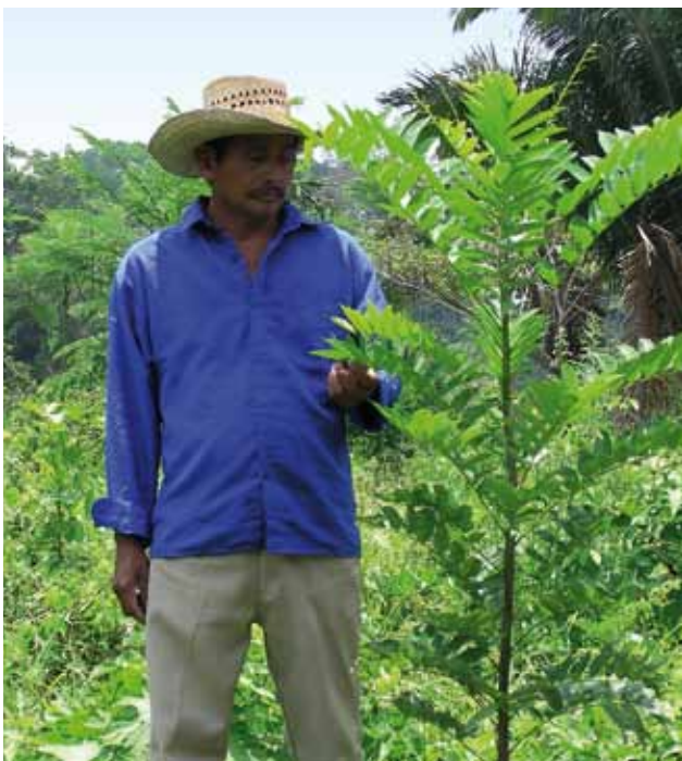
Die Wahl der Bäume ist essentiell – Standortangepasste und heimische Baumarten sollten angepflanzt werden.

ziehen und regionale Zusammenhänge zu betrachten. Zudem ist eine enge Verknüpfung mit sozialen Aspekten gegeben, wenn die so genannten Ökosystem-Dienstleistungen der Gebiete einbezogen werden: So haben z.B. Wälder Einfluss auf die regionale Wasserverfügbarkeit, die für die Grundversorgung umliegender lokaler Gemeinden eine große Rolle spielt.