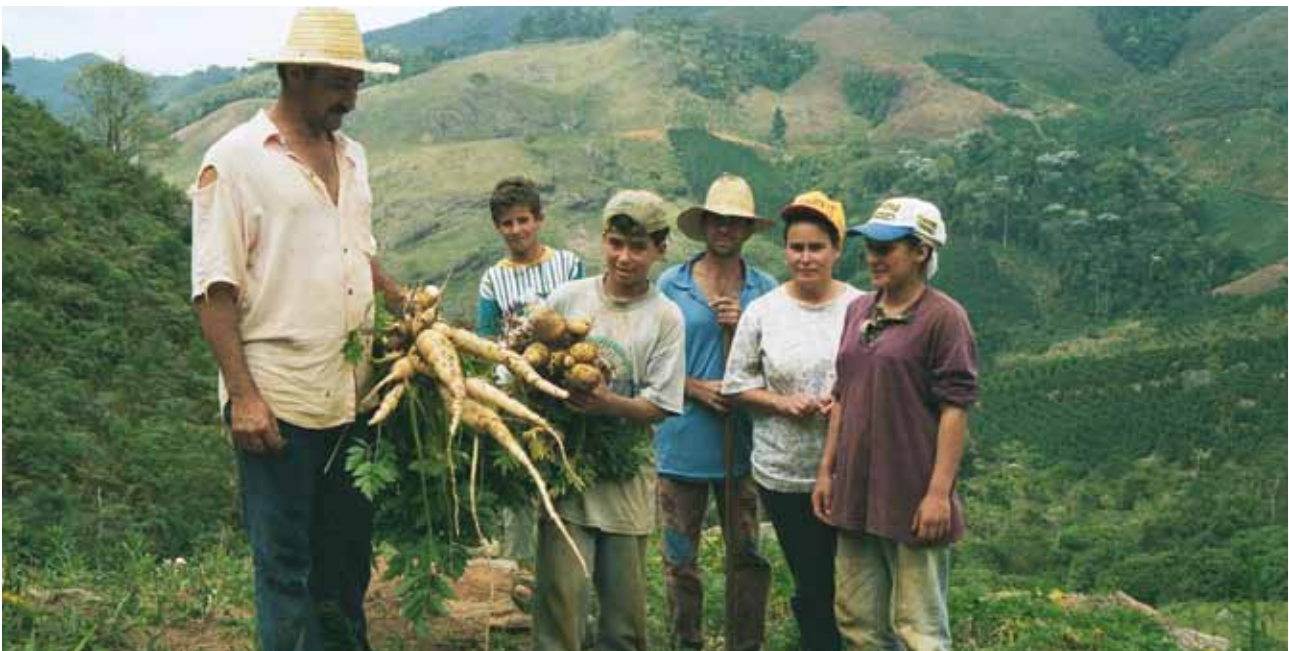
Die Einbindung der lokalen Bevölkerung und die sozialen Wirkungen der Projekte werden von den Standards unterschiedlich berücksichtigt.

Genau wie beim CCBS können mit dem Social Carbon Standard (SCS) keine handelbaren Emissionszertifikate generiert werden – eine Zertifizierung mit einem zweiten Standard ist hierfür notwendig. Der Social Carbon Standard basiert auf einer von der brasilianischen Nichtregierungsorganisation Ecologica Institute im Jahr 1998 entwickelten Methodik. Das Ziel des Standards ist es, die soziale, ökologische und ökonomische Leistung von CO 2 -Kompensationsprojekten kontinuierlich zu verbessern. Derzeit sind 43 Projekte im Zertifizierungsprozess, bisher jedoch ausschließlich Projekte im Energiebereich.