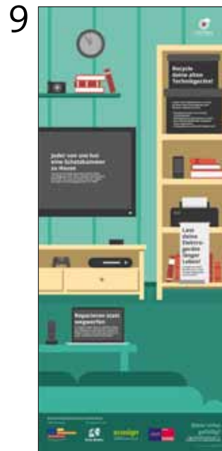
Handlungstipps zum Thema Bodenschätze und Elektronik