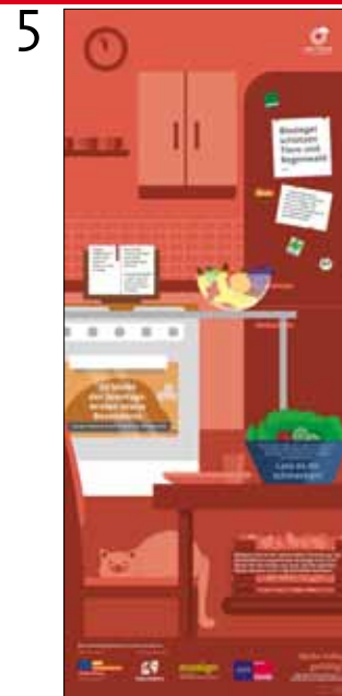
Handlungstipps zum Thema Soja und Fleisch