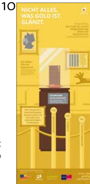
Nicht alles was gold, ist glänzt.