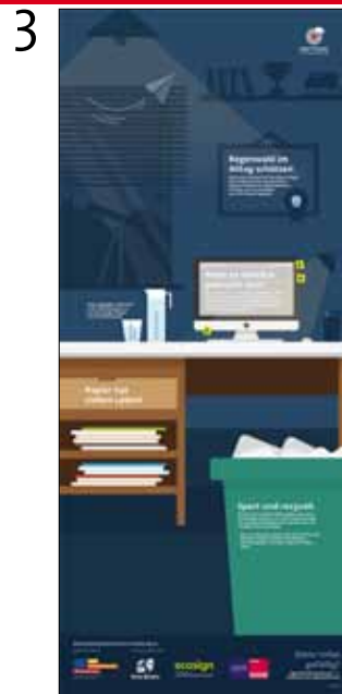
Handlungstipps zum Thema Papier