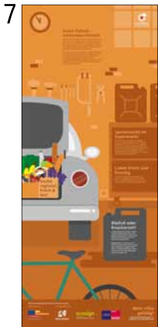
Handlungstipps zum Thema Palmöl.