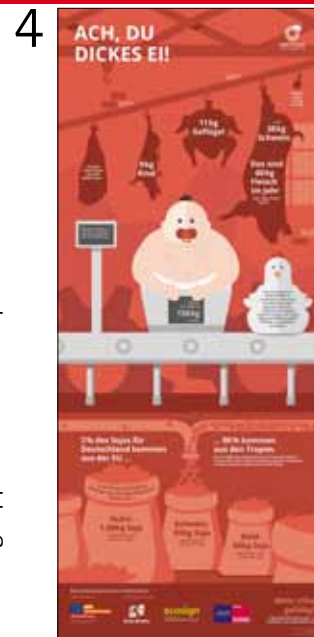
Ach, du dickes Ei!