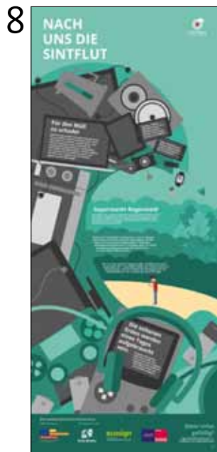
Nach uns die Sintflut.