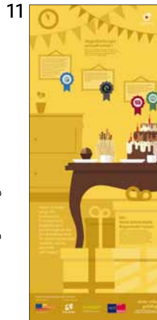
Handlungstipps zum Thema Kakao und Schokolade

Der Aufbau der Tafeln ist einfach und unkompliziert. Das geringe Gewicht ermöglicht den flexiblen Einsatz an vielen Orten. Die Ausstellung ist ausschließlich für den Innengebrauch geeignet. Maße: 200cm hoch x 85cm breit. Eine Ausstellungsfläche von etwa 20 Quadratmetern ist ideal.