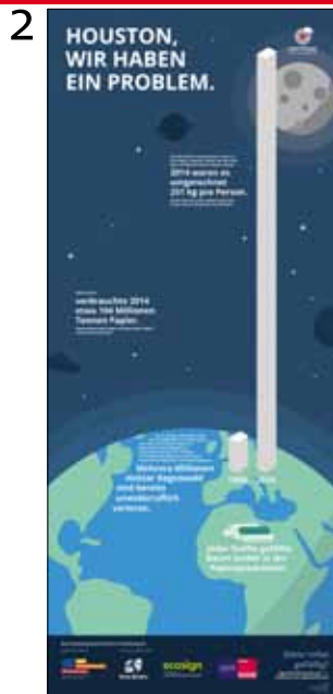
Houston, wir haben ein Problem.