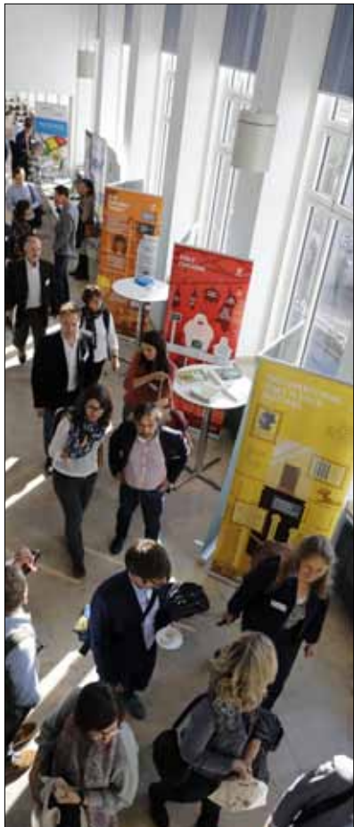
Im Foyer: Die Ausstellung lädt zu Diskussion und Reflektion ein.

Erleben Sie Regenwaldschutz einmal aus einem anderen Blickwinkel und erfahren wie der Regenwald vor der Vernichtung gerettet werden kann: Die Wanderausstellung von OroVerde vermittelt auf einfache Weise die globalen Folgen des heutigen Konsums auf die letzten Regenwälder und gibt Einblicke in Handlungsmöglichkeiten für den Alltag.