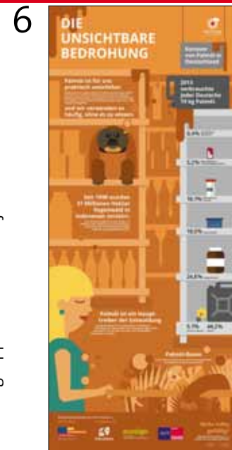
Die unsichtbare Bedrohung.