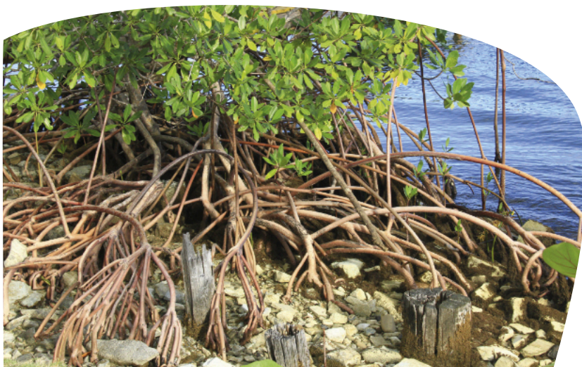
Mangroven sind wertvolle Lebensräume zwischen Land und Meer.

DANKE! Ihre Spende hilft! Alle unsere Projekte finden Sie unter www.oroverde.de/projekte