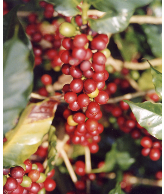
Nachhaltig angebauter Kaffee trägt zum Schutz von Wald, Boden und Biodiversität bei.