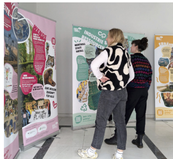
Die Wanderausstellung motiviert, die Welt aktiv (mit)zugestalten.

Mehr erfahren: www.ooverde.de/weltweite-wende