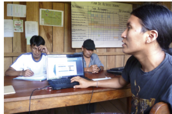
Gemeinsame Datenauswertung für den Schutz indigener Territorien.

Gefördert wird das Projekt vom Bundesministerium für wirtschaftliche Zusammenarbeit und Entwicklung (BMZ).