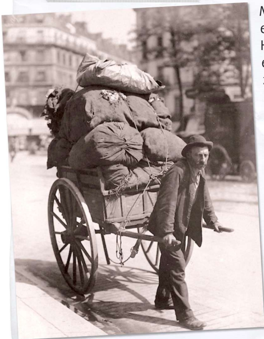
Ein Lumpensammler in Paris, Avenue des Gobelins, Paris, 1899

Die lange Geschichte des Papiers und dessen Weiterentwicklung bis zum heutigen Produkt finden Sie auf der Lehrerinfo 2 A.