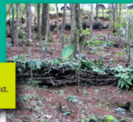
Barrera en parcela de café en la comunidad de Cenovi, Rep. Dominicana.

*Barrera muerta: Conformación de cordones de material vegetal muerto existente en el terreno, acomodado a curvas de nivel para fomentar la reducción de la erosión y la regeneración del suelo.