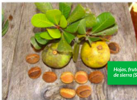
Hojas, frutos y semillas del sapote de sierra ( Sideroxylon moanse )

Se describe como nuevo para la ciencia en 1985, sin embargo, sus frutos y semillas se colectan por primera vez y se describen en el 2016; son similares al canistel , aportan alimentos para la fauna silvestre y pueden ser consumidos por los humanos.