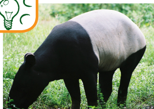
Der kleine Rüssel ist ein Multifunktionswerkzeug. Er dient zum Tasten und Riechen.