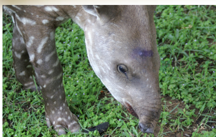
Jungtier auf Nahrungssuche. Dabei nutzt es seinen Rüssel, um die Gräser zu zupfen.

Der Schabrackentapir steht auf der Roten Liste der weltweit bedrohten Tierarten als „gefährdet“.